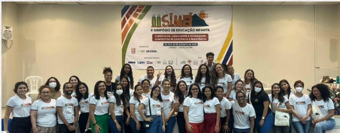
Registro da Comissão Organizadora do II SIMEI

Grupo de Pesquisa e Extensão em Educação da Infância, Cultura, Currículos e Linguagens