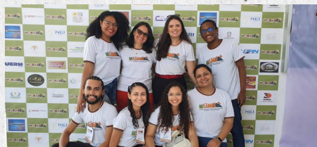
Registros de Atividades de Extensão e Pesquisa