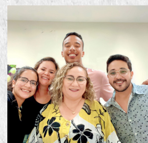
Registros de Reuniões de Estudo e Pesquisa